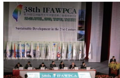
The 38th IFAWPCA Convention in Taipei 第38回 IFAWPCA 総会

国内建設業の国際化に資するため、国内の建設業団体などが主催するセミナーに、海外工事に係わる知識、契約及び制度などの専門家を講師として派遣するなど、これからの海外建設活動に取組もうとする企業の相談に応じています。