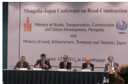
Mongolia-Japan Conference on Road Construction 日本モンゴル道路建設会議