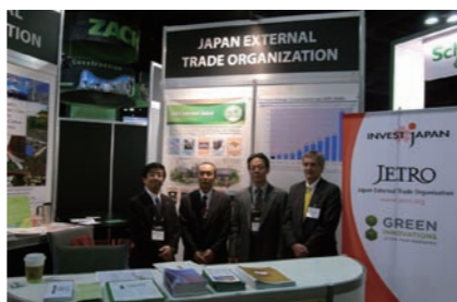
Renewable Energy World Conference & Expo in Tampa, USA タンパ再生可能エネルギー見本市