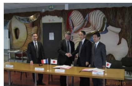
Liaison with Related Organizations, FRANCE 国際交流