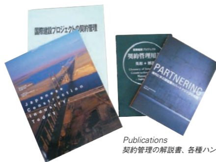
Publications 契約管理の解説書、各種ハンドブック、辞書

わが国建設業の先進的技術紹介資料、わが国海外建設事業に関する資料、海外赴任に関する手引き書等の出版物を刊行しています。