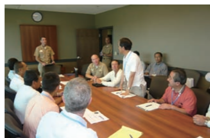
Overseas Surveys 案件発掘・形成