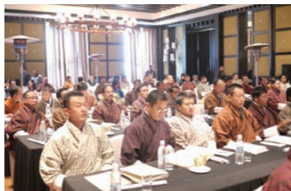
Technology seminar in Bhutan ブータン建設技術セミナー