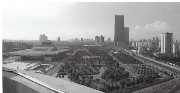
国際会議場と70階建て商業ビル