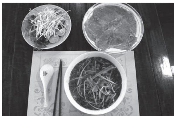
40ドルの神戸牛フォー

一方で、20%を超える消費者物価の上昇（前年同月比）、120億ドル強の貿易赤字そして、ベトナムドン通貨の下落が続いており、政府としては「輸出の促進、金融引締めそして公共投資の削減」を図り、今までの行け行けどんどの経済成長路線から軌道修正を講じている。このことはベトナムの株式市場にも影響を及ぼし、ベトナム経済ならびに企業への高い期待から積極的に資金を投じてきた外国人投資家が資金提供を一時的に引き上げている。金融引締め政策は負の企業活動を与える要因となるか、状況を見守りたい。