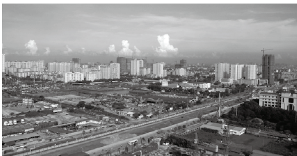
開発が進むハノイ西地区1

北部においては、紀元前111年からは漢による支配が始まり、西暦938年までの約千年の間、中国によって支配され続けた。その後、独立したベトナムは首都をハノイの南90kmのホアルーに置き統治する。1010年の李朝からは首都をタンロン(現在のハノイ)に移し、途中中国の明の支配もあったが陳朝-黎朝と続き、1802年には南部でチャンパ王国の衰退を機にフランス、イギリス、タイ、カンボジアの力を借りて勢力を広げた阮朝が初めて南北統一を果たす。この後、100年にわたる辛いフランス植民地時代に突入するが、そのきっかけをつくったのがこの阮朝とも言われている。1840年のアヘン戦争後から始まったフランス植民地政策は、それまで使用してきた漢字表記の言語をローマ字表記に変え、またベトナム独自の文化も否定し、塩の専売権も持ち、そして開